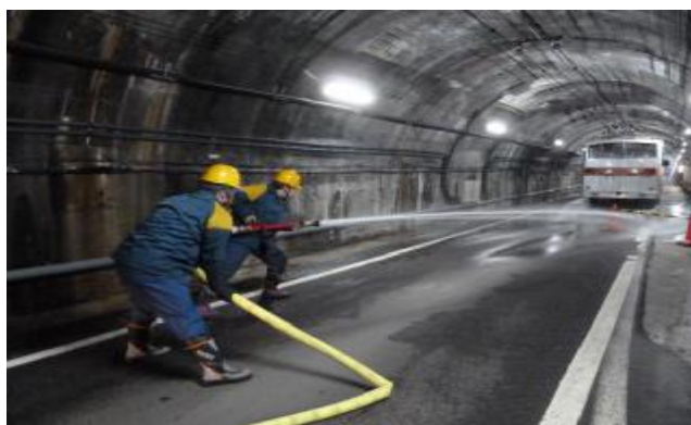
( 事故想定訓練 )

関電トンネル無軌条電車は、走行区間全長6.1kmの内、5.4kmがトンネル内で、事故災害等緊急時の対応は、さまざまな問題や救助方法等の制約が考えられます。毎年4月の営業開始前にトンネル内の事故を想定し、火災の消火訓練、被災者救出訓練ならびに故障車両の搬出訓練等を実施し、非常事態に対処できるよう備えております。