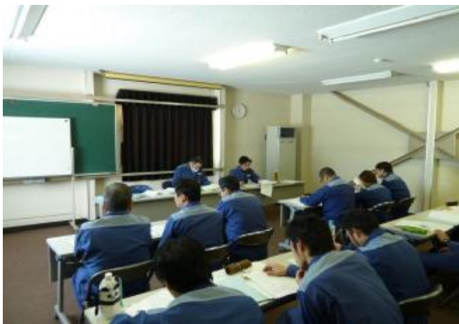
( 教育受講風景 )

運転取扱実施基準に基づく安全輸送教育ならびに、外部講師を招いた接遇等の教育を実施し、安全運転の徹底とお客さまサービスの向上を図っています。また、安全を含むさまざまな問題解決に取り組むべく、5つのサークルによるQCサークル活動を展開しています。