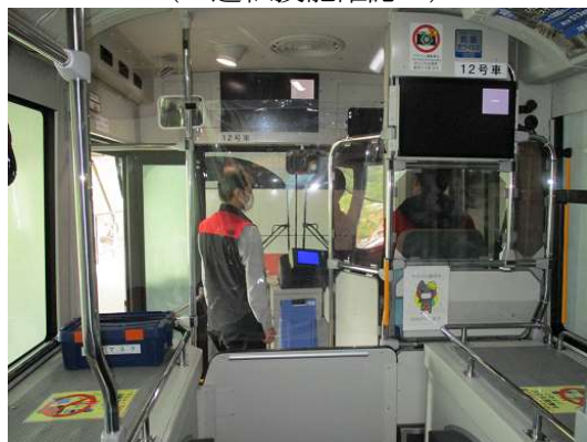
( 運転技能確認 )

営業開始の4月、運転員の運転技能・運転基本動作について指導・確認を行い、運転技能維持および安全意識の定着に努め、事故の未然防止を図っております。