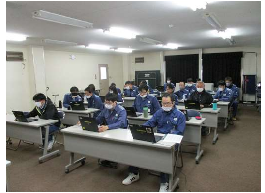
( 取扱所則教育 )

運転取扱所則に基づく安全輸送教育を実施し、安全運転の徹底とお客さまサービスの向上を図っております。また、安全を含む様々な問題解決に取り組むべく、サークル活動を展開しております。