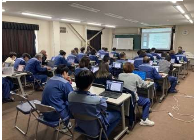
( 取扱所則教育 )