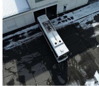
( 後退運転訓練 )