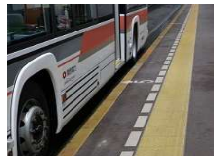
(扇沢駅降車ホーム)