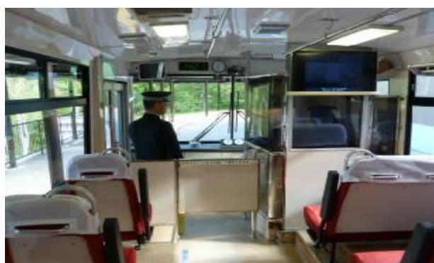
( 運転技能確認 )

関電トンネル無軌条電車は、冬期休業明けとなる4月の営業開始前とお客さまの多い8月の繁忙期前の2回、運転士の運転技能、運転基本動作について確認を行い、運転技能維持および安全運転意識の定着に努め、事故の未然防止を図っております。