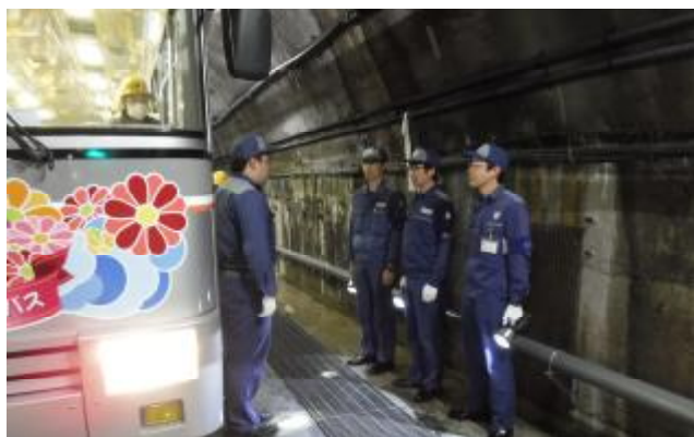
( 事故想定訓練 )

関電トンネル無軌条電車は、走行区間全長6.1kmの内、5.4kmがトンネル内で、事故災害等緊急時の対応は、さまざまな問題や救助方法等の制約が考えられます。毎年4月の営業開始前にトンネル内の事故を想定し、火災の消火訓練、被災者救出訓練ならびに故障車両の搬出訓練等を実施し、非常事態に対処できるよう備えております。