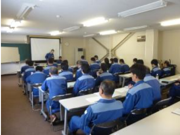
( 教育受講風景 )

運転取扱実施基準に基づく安全輸送教育ならびに、外部講師を招いた接遇等の教育を実施し、安全運転の徹底とお客さまサービスの向上を図っています。 また、安全を含むさまざまな問題解決に取り組むべく、5つのサークルによるQCサークル活動を展開しています。